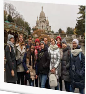
A Annecy, à Chamonix, à Seynod, et même à Paris ....