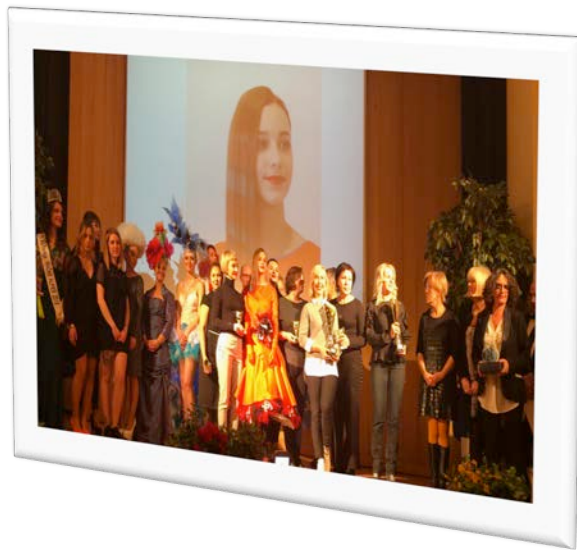
A Lyon, Salon de la Beauté, Show mode à la CCI d'Annecy