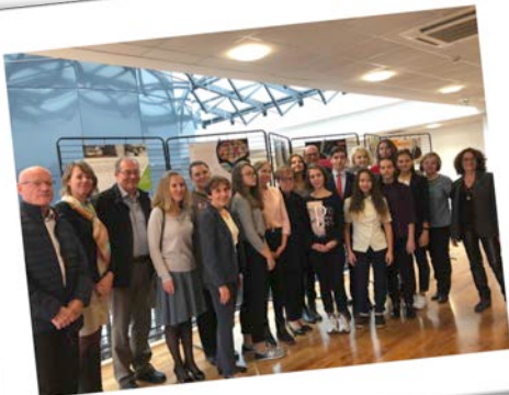
Les coiffeuses russes de la Société Beauty Art étaient avec nous en novembre pour participer au Concours Beauté Sélection à Lyon, en compagnie de leurs collègues françaises, sous la direction avisée de la FNC74